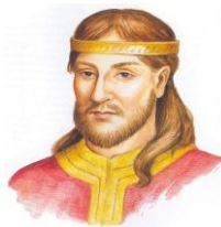
údajná podoba kníže Mojmir

Politická situace na pod. 9. století (do roku 833): ● Nitransko za Pribinu ○ Morava na podléhu Mojimirovy vládě — hranice moderních států