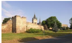
Přemysl Otakar II.